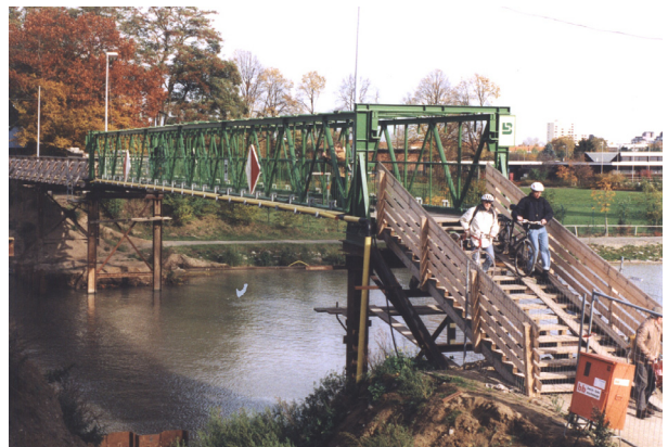
FB-42/2,5 Behelfsbrücke über den Mittellandkanal in Hannover – L= 36,00m