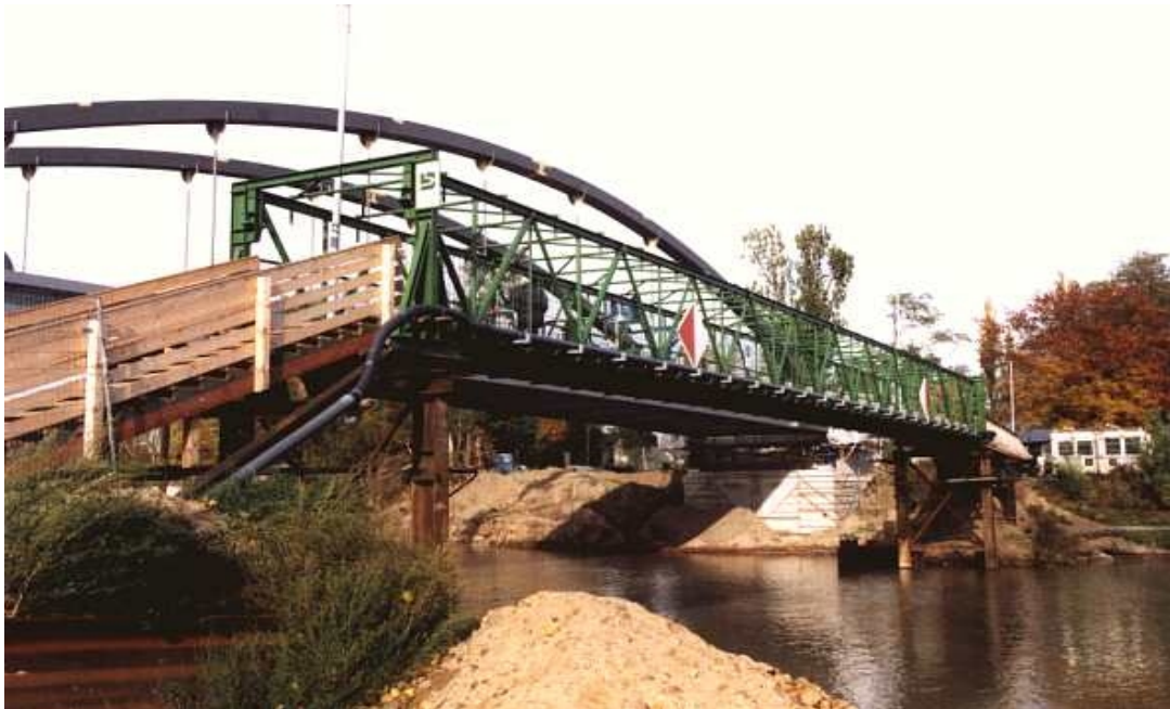
FB-42/2,5 Behelfsbrücke über den Mittellandkanal in Hannover – L= 36,00m