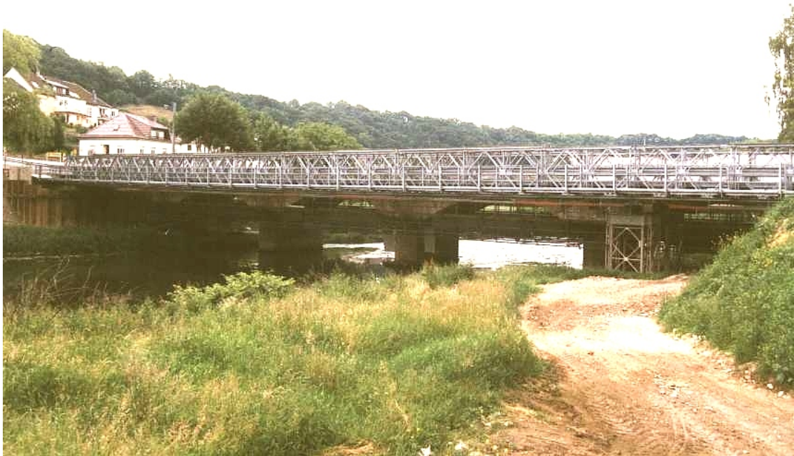
MU-Brücke – Typ DSHR2 – Luxemburg