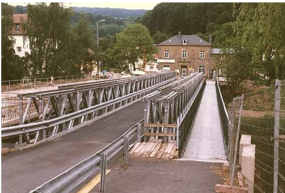
MU-Brücke – Typ DSHR2 – Luxemburg